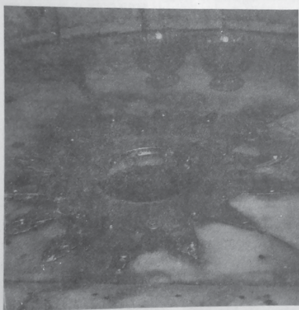
Gwiazda w grocie Narodzenia w Betlejem

Do prezentowanych wydarzeń w Kościele powszechnym i w Polsce, w danym roku liturgicznym lub kalendarzowym – ujętych w cyklach rocznych – nawiązywała korespondująca z nimi tematyka franciszkańska, związana ze św. Franciszkiem, świętymi franciszkańskimi czy faktami z historii zakonów franciszkańskich. Ponadto w cyklach stałych – np. „Modlitwy/Pisma św. Franciszka”, „Lekcje z franciszkanizmu”, „Miejsca franciszkańskie”, „Ziemia Święta/Miejsca święte”, „W nurcie formacji” – czytelnicy mogli i wciąż mogą zapoznawać się z treścią formacyjną z zakresu naszej duchowości lub ogólną z franciszkanizmu czy z zagadnień z życia zakonnego (np. listy okolicznościowe ministrów generalnych FZŚ i I zakonu franciszkańskiego), uzupełnianą nauczaniem Magisterium Kościoła i jego pasterzy (np. KKK, encykliki, adhortacje, listy apostolskie).