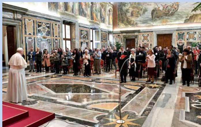
Uczestnicy kapituły generalnej na audiencji u papieża Franciszka, Watykan 15 listopada 2021 r.