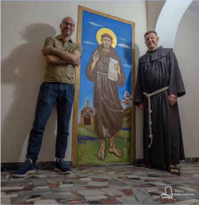
Święty Franciszek – posłaniec Bożego pokoju (obraz na ścianie w części gościny klasztoru)

Dzień dobry, dobrzy ludzie – Buon giorno, buona gente (obraz namalowany na ścianie w starym refektarzu)