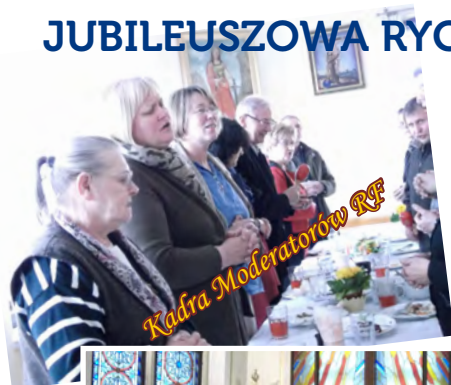
Kadra Moderatorów RF