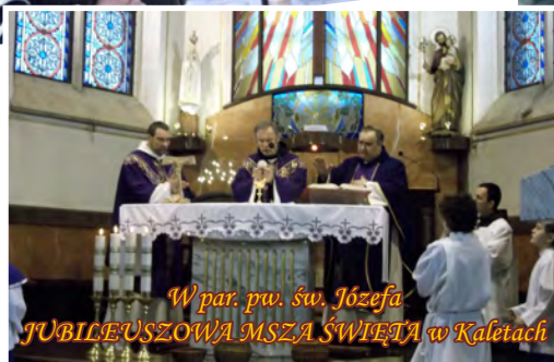
W par. pw. św. Józefa JUBILEUSZOWA MSZA ŚWIĘTA w Kalęczach